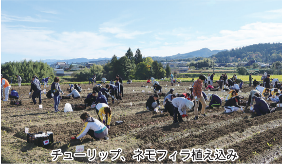
チューリップ、ネモフィラ植え込み