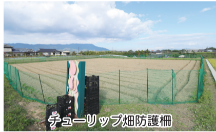
チューリップ畑防護柵

はしもと紀の川花夢計画 「恋のチューリップ畑」に防護柵設置 橋本商工会議所の「はしもと紀の川花夢計画 恋のチューリップ畑」では、過去六年間地域の観光資源としてチューリップを育ててきましたが、前回シカによる被害で多くの花が傷つけられ、チューリップ畑の景観に影響を及ぼす事態となりました。このため今年には対策として畑全体を囲む防護柵の設置作業を行いました。これにより今回はシカによる被害が抑えられることを期待しています。