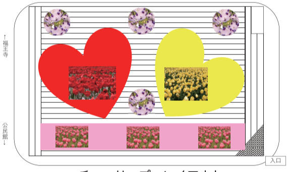
チューリップ レイアウト