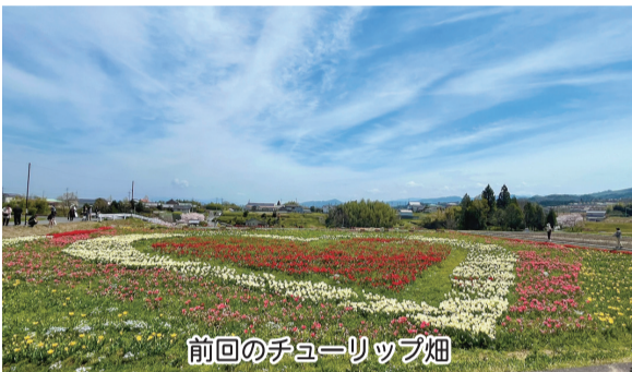
前回のチューリップ畑